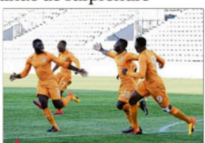
Les Ivoiriens ont logiquement battu la République tchèque hier et affronteront l'Angleterre en finale, demain. (J.M/S) S.C.

En seconde période, la Côte d'Ivoire aurait pu abaisser le score avec plus d'efficacité et de réussite. Mais Amani, par deux fois, a buté sur Jan Pfafl (49, 66) alors que la tête de Loba a trouvé la